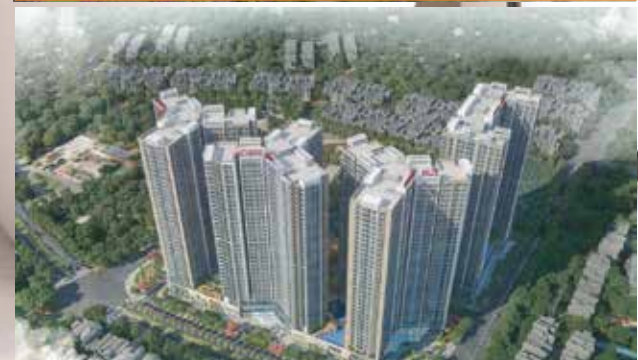
CHUNG CƯ HOÀNG HUY COMMERCE