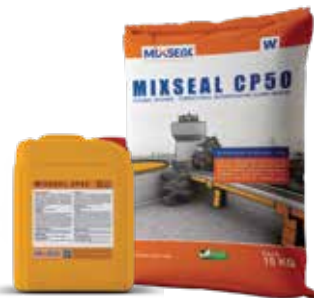
Đóng sẵn trong bộ 20 Kg