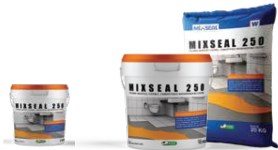
Đóng sẵn trong bộ 32 Kg hoặc thùng 4kg

Độ tiêu hao vật liệu cho 2 lớp: 2.0 -3.0 (kg/m 2 ) Sử dụng tốt trong 12 tháng kể từ ngày sản xuất khi bao bì nguyên vẹn chưa mở. Lưu trữ nơi khô ráo, thoáng mát.