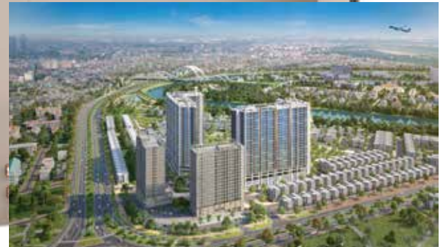
THE MINATO RESIDENCE HẢI PHÒNG