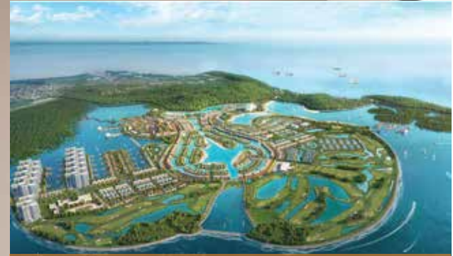
KHU DU LỊCH QUỐC TẾ ĐỒI RỒNG